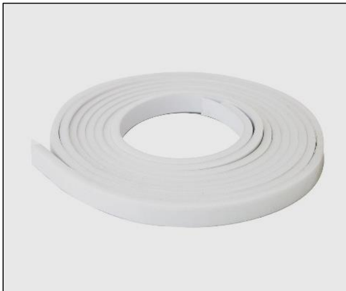
FIGURA N°1: IMAGEN REFERENCIAL:

En las figuras que se muestran a continuación, se presenta los metrados (210 metros lineales) para las puertas de metal según medidas: